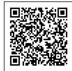
eラーニング研修について

【H P】 https://kensyu.hokenfukushi.or.jp/e-learning2.html